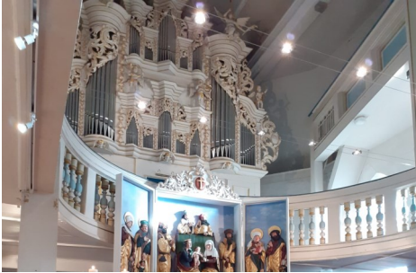
Schróter Orgel in Wandersleben