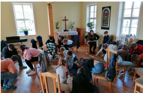
Hier ein kleiner Einblick in unsere Konfi-Zeit im Pfarrhaus Wechmar

Die Namen der Konfirmanden finden Sie in der gedruckten Ausgabe des Gemeindebriefes.