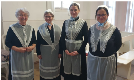
Schwestertracht zur Christnacht