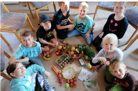
hier im Pfarrhaus Seebergen