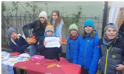
Waffelstand der Jugend