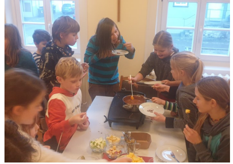
Kindergruppe und Jugendgruppe mit Schokofondue

Der Mensch ist so viel Mensch, wie er liebt.