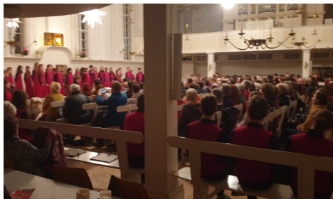
Konzert der Chorakademie Erfurt