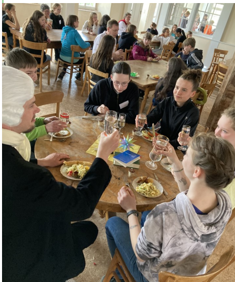
Einblick in das Konficamp auf dem Heernhaag 2023